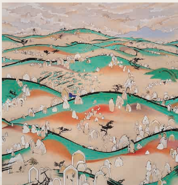
《脱色の街-アニミータ》一幅 絹本彩色 2020年

寅と申の年に諏訪地方で行われる御柱祭は、山から切り出した巨木を氏子たちが曳き、社殿の四隅に建てるというお祭です。1200年以上連続と受け継がれていますが、なぜ行うかは分かっておらず、どう行うかだけが伝えられています。