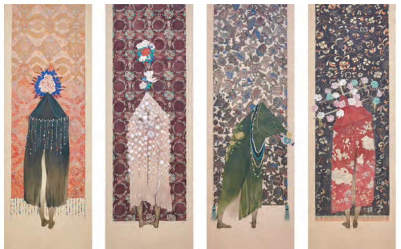
中村恭子筆《書割少女》 各一幅、絹本彩色、84.5×30 cm、2020-21年