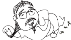
早稲田大学 非常勤講師 (哲学)