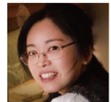
九州大学 助教 (日本画)