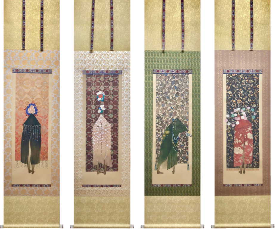
中村恭子筆《書割少女》 各一幅、絹本彩色、84.5×30 cm、2020-21年 表装：装雅堂（勝村真光）

本シンポジウムは 左記「中村恭子日本画作品展 書割少女」(新潟大学旭町学術資料展示館) を記念し、関連イベントとして開催するものです。 展覧会では《書割少女》含む作品10点程度を公開いたします。 シンポジウムと合わせてご高覧の程よろしくお願いたします。