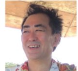
早稲田大学 教授 (生命基礎論)