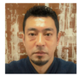
装雅堂 表装師 (表装)