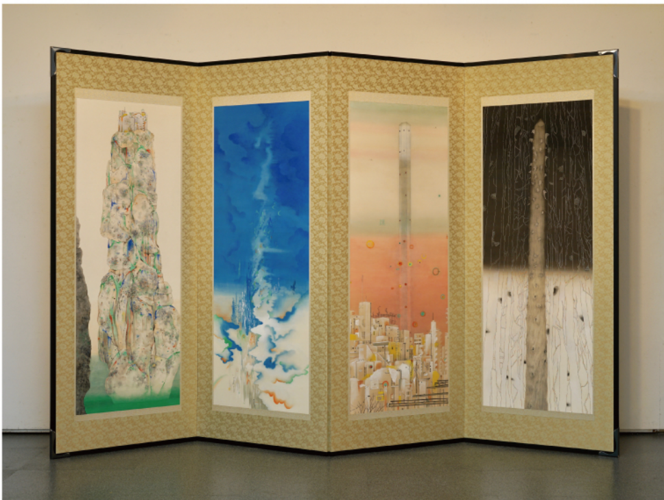
中村恭子 筆《御柱図絵屏風》