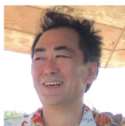
早稲田大学 教授 (天然知能)