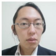
神戸大学 助教 (生物計算機)