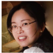
九州大学 助教 (日本画)